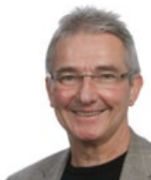
HORST THON LISTENPLATZ 10

B. Sc. Wirtschaftsinformatik Carl-Maria-von-Weberstr. 2 63069 Offenbach Tel.: 069 - 84 28 80 Mobil: 0163 - 504 72 76 Fax: 069 - 83 00 72 40 martin.wilhelm@spd-online.de